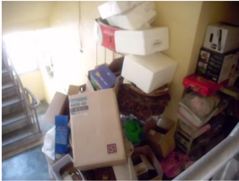
公共空間佔用阻礙逃生安全