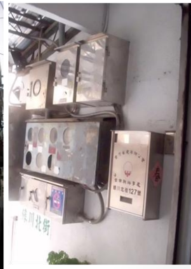
管線、電箱凌亂外露